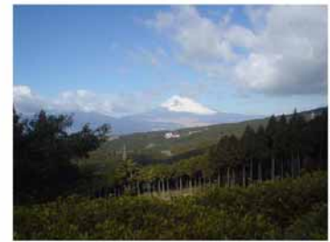
箱根街道沿いの富士山