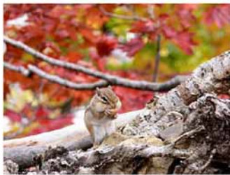
ドングリを食べるシマリス